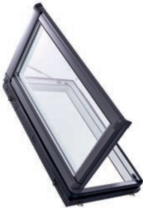
Bild zeigt Flügelanschlag rechts von innen gesehen.

Dachfenster in Kunststoff für beheizte Dachräume zum Austausch alter Roto Wohndachausstiege von 1983 bis 2004